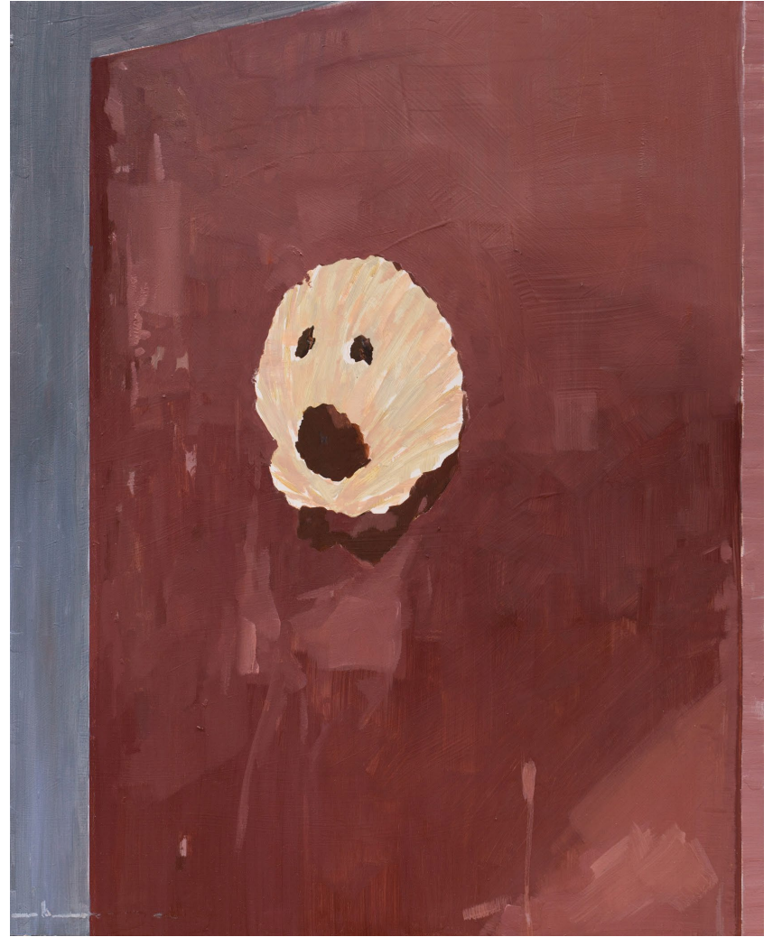
<전투용 가면>, 2024. 캔버스에 유화, 60.6x50cm. <조개 가면>, 2023. 판넬에 유화, 65.1x53cm.