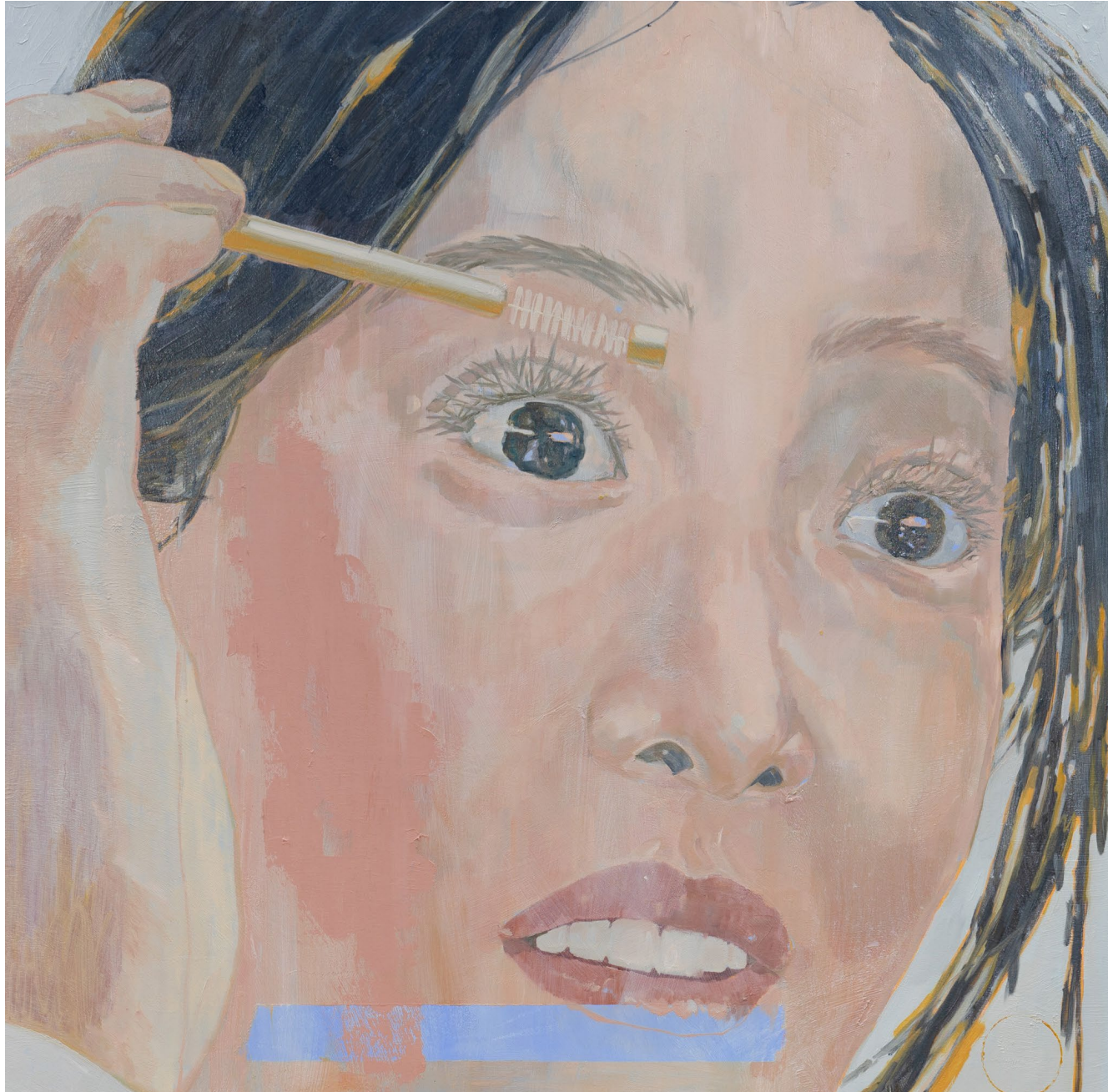
<하루에 한 번 자기 전 바르세요>, 2023. 캔버스에 유화, 97x97cm.