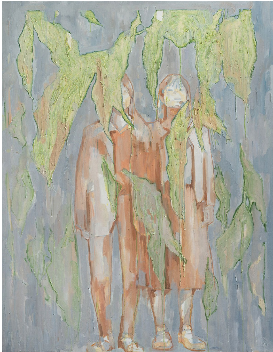
<도토리 키 재기>, 2020. 캔버스에 유화, 116.8x91cm.