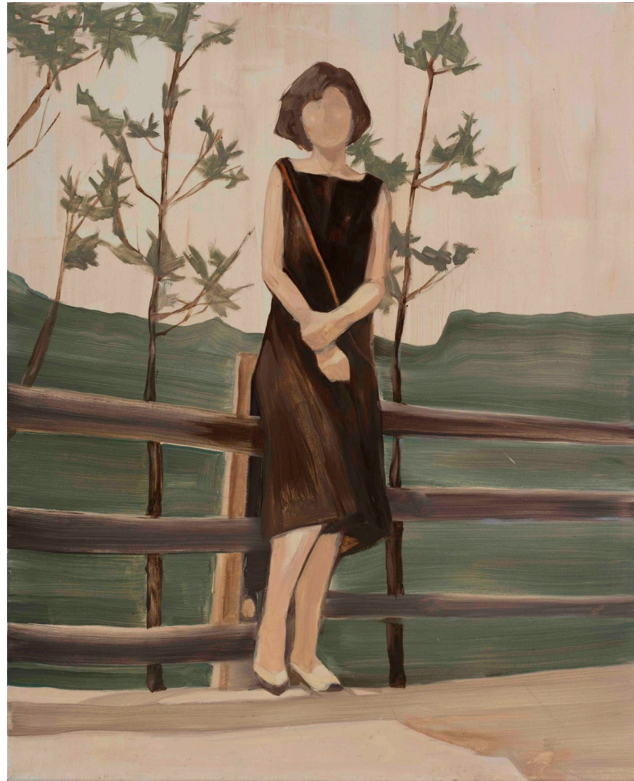
<엄마>, 2017. 캔버스에 유화, 65.1x53cm.