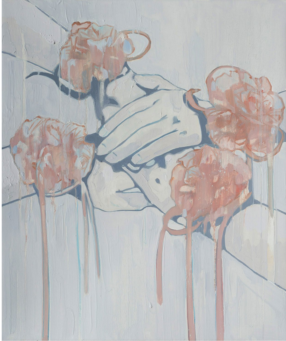
<손에 손 잡고>, 2020. 캔버스에 유화, 72.7x60cm.