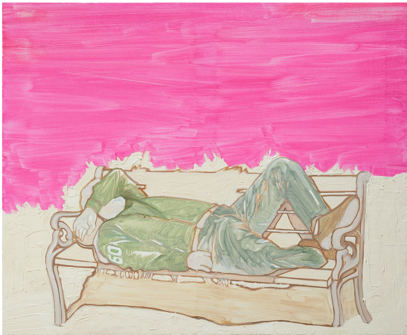
<불타는 휴식>, 2017. 캔버스에 유화, 45x53cm.