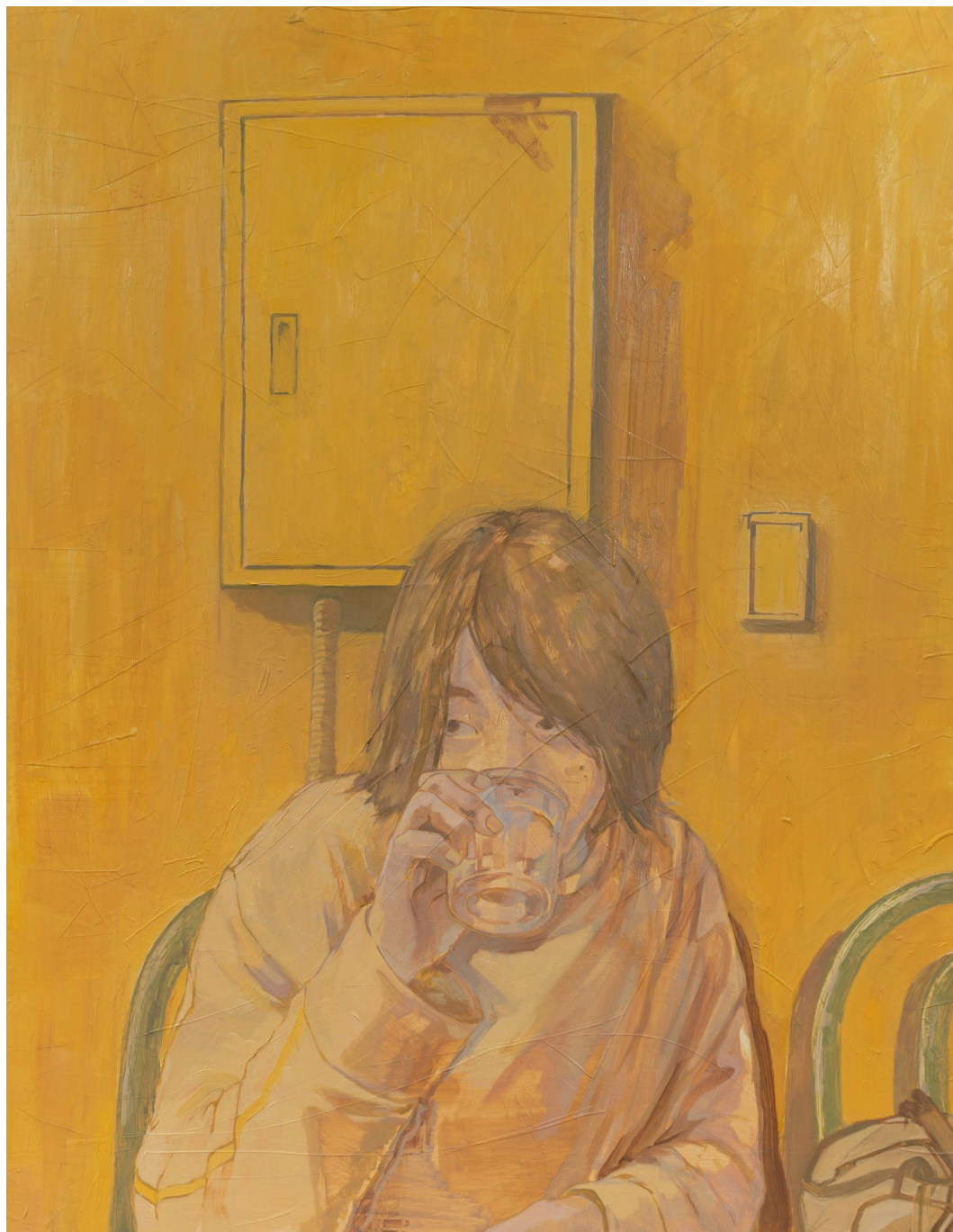
<아무도 고민이라고 여겨주지 않는 고민>, 2023. 캔버스에 유화, 116.5x91cm.