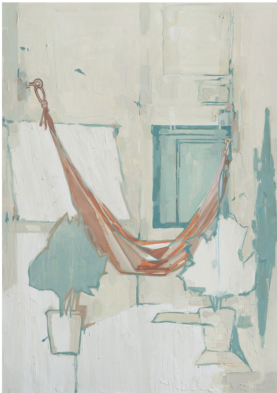
<휴식을 위한 해먹>, 2020. 캔버스에 유화, 90.9x72.7cm.