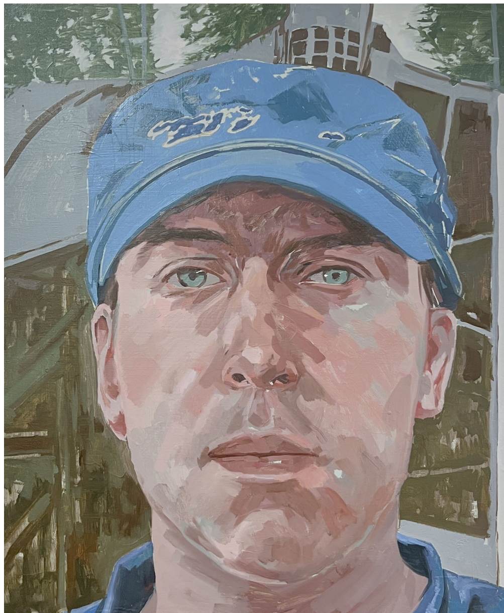
<어디 사는 누구1>, 2024. 캔버스에 유화, 60.6x50cm.