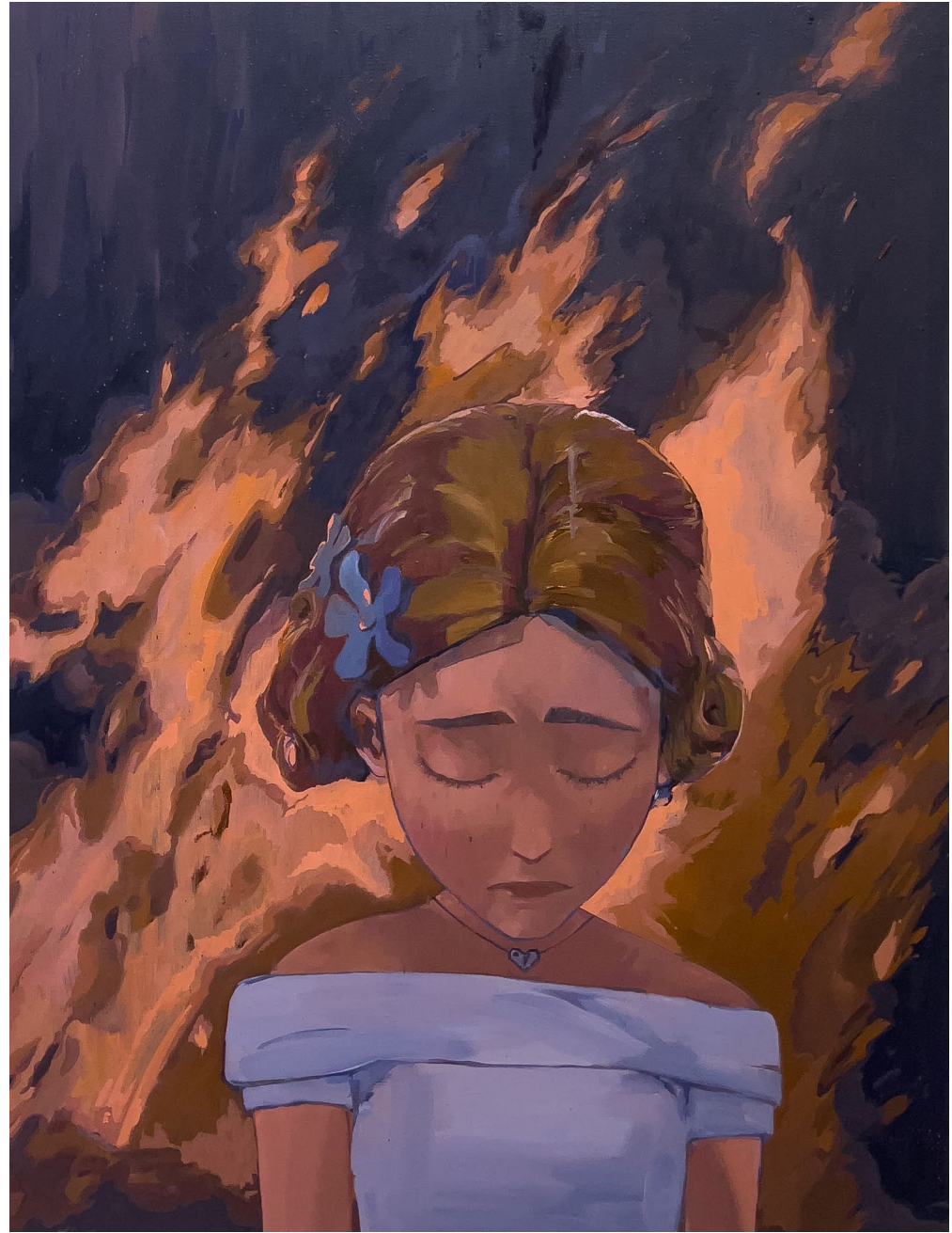
유숙형, <우리의 눈을 가리는 것들1>, 2023. 캔버스에 유화, 116.8x91cm. 유숙형, <우리의 눈을 가리는 것들2>, 2023. 캔버스에 유화, 116.8x91cm.