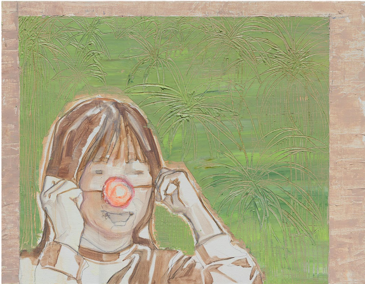
<생일 파티>, 2020. 캔버스에 유화, 40.9x53cm.