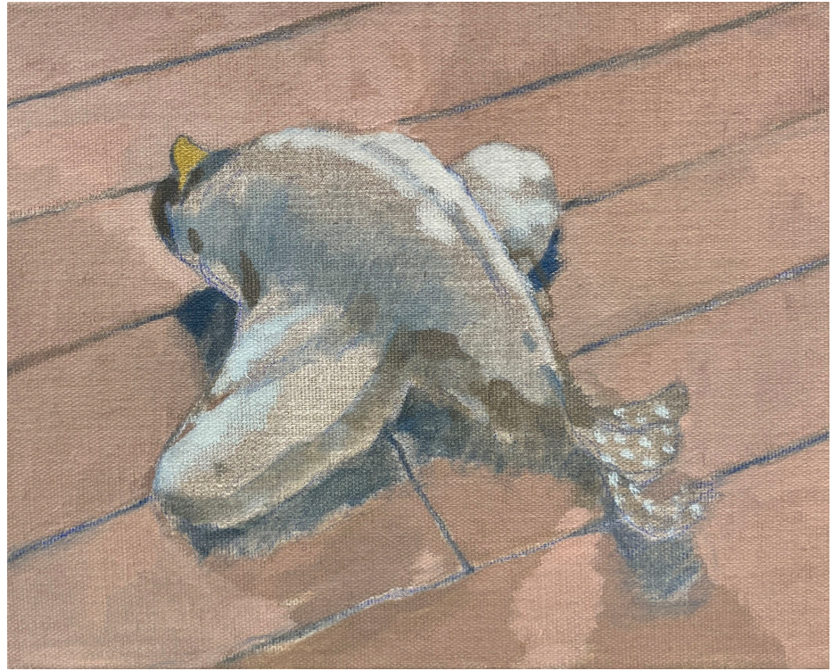
<Still Life>, 2023. 캔버스에 유화, 22x27.5cm. <행복입니다>, 2023. 캔버스에 유화, 27x27cm.