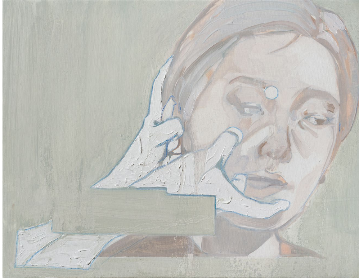
<Endless>, 2020. 캔버스에 유화, 40.9x53cm.