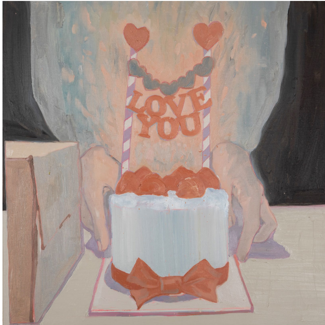
<Luv U>, 2021. 캔버스에 유화, 50x50cm.