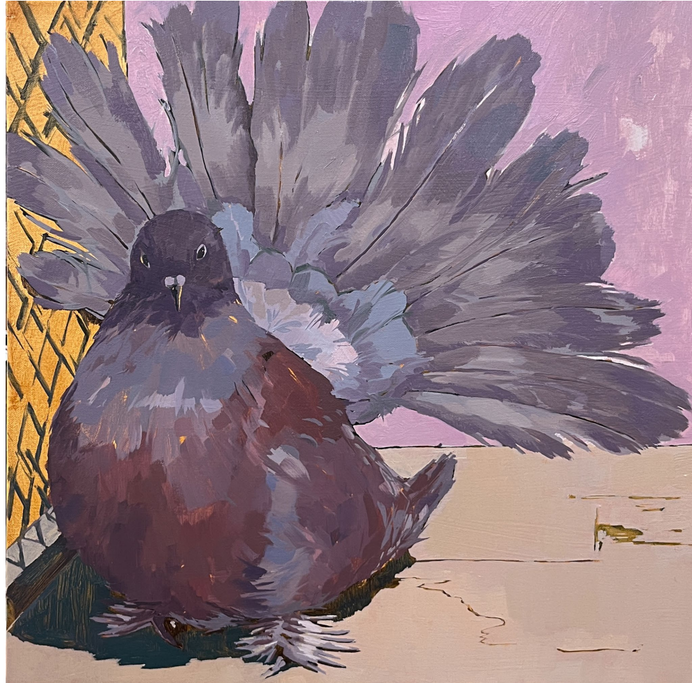
<조금 낮선 비둘기>, 2024. 캔버스에 유화, 45.5x45.5cm.