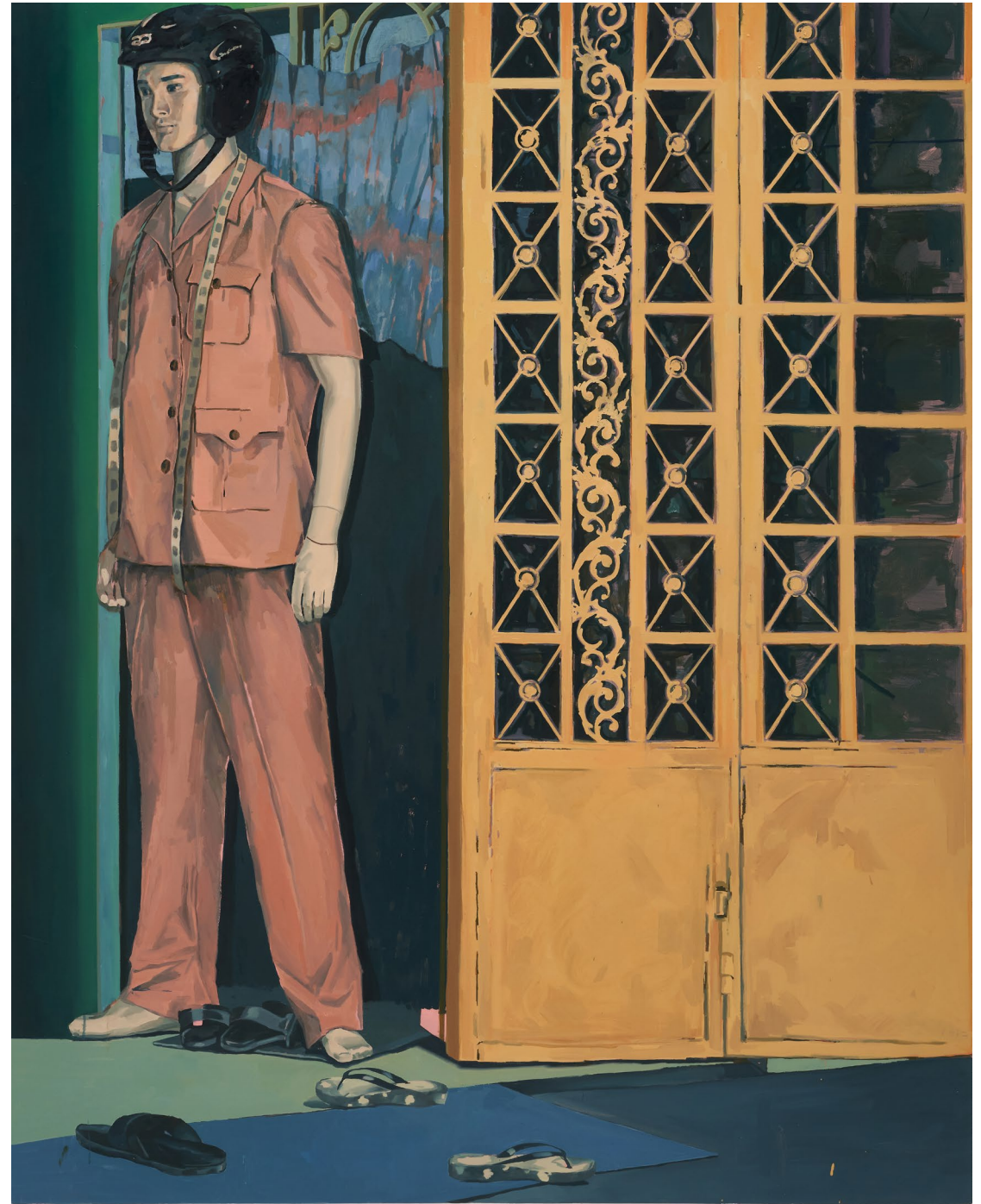
<이 길이 아니긴 해 >, 2024. 캔버스에 유화, 162.2x130.3cm.