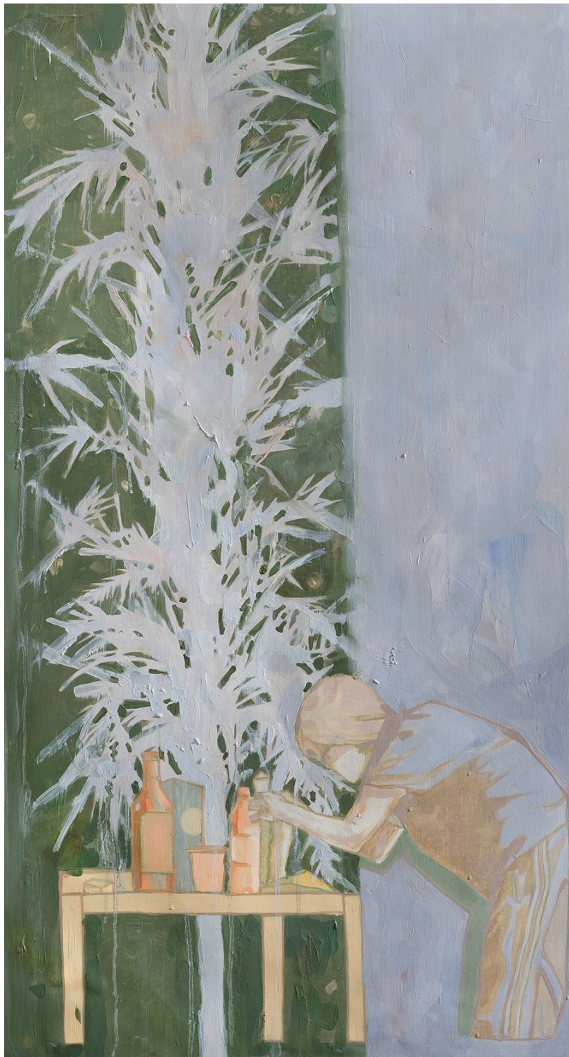
<초코우유를 텀블러에 따라 마시는 것에 대하여>, 2020. 캔버스에 유화, 103x54cm.