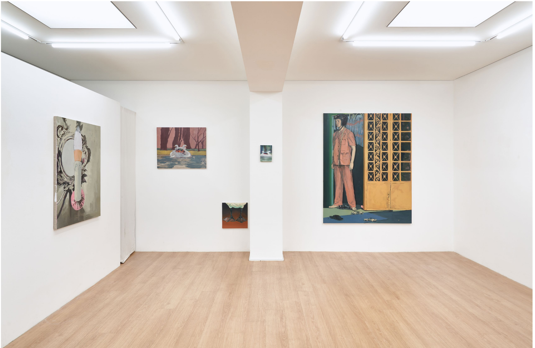
<어그로-스왑> 전시 전경