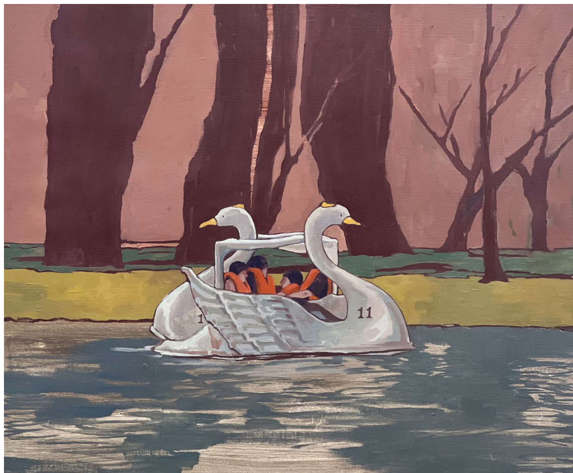
<11x11>, 2023. 캔버스에 유화, 60.6x72.7cm.