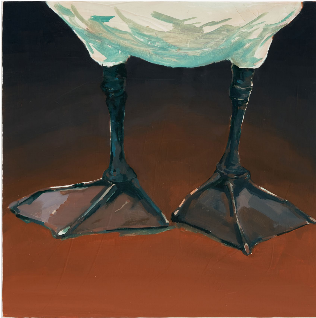
<범상치 않은 잡몹>, 2024. 캔버스에 유화, 37.9x37.9cm.