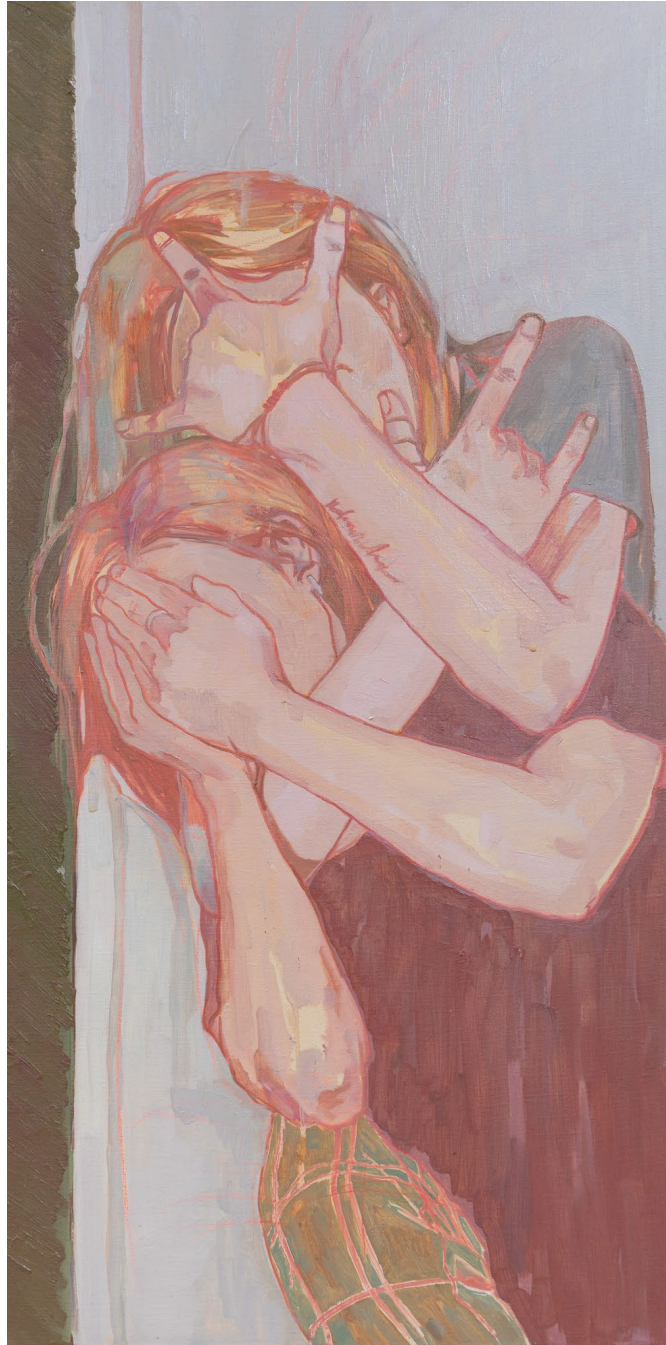
<크리스마스색 체크무늬 바지>, 2022. 캔버스에 유화, 100x50cm.