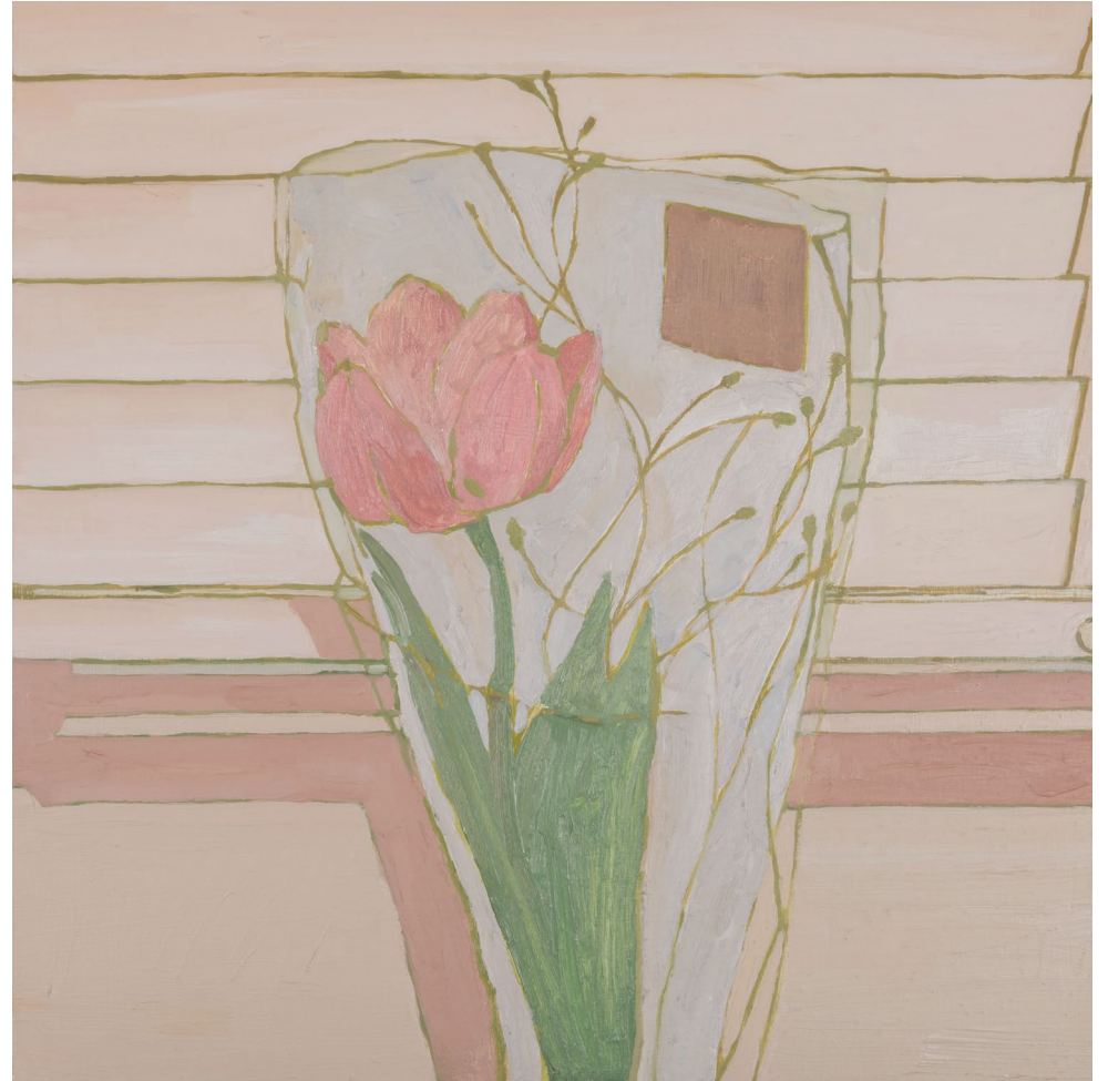
<Blind Flower>, 2022. 화판에 유화, 45x45cm.