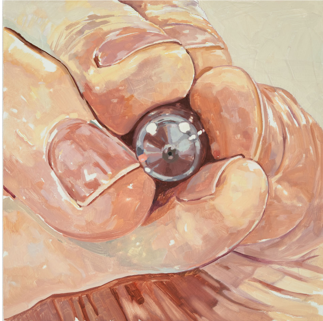
<가끔 이런걸 확대해 볼 때가 있다>, 2024. 캔버스에 유화, 37.9x37.9cm.