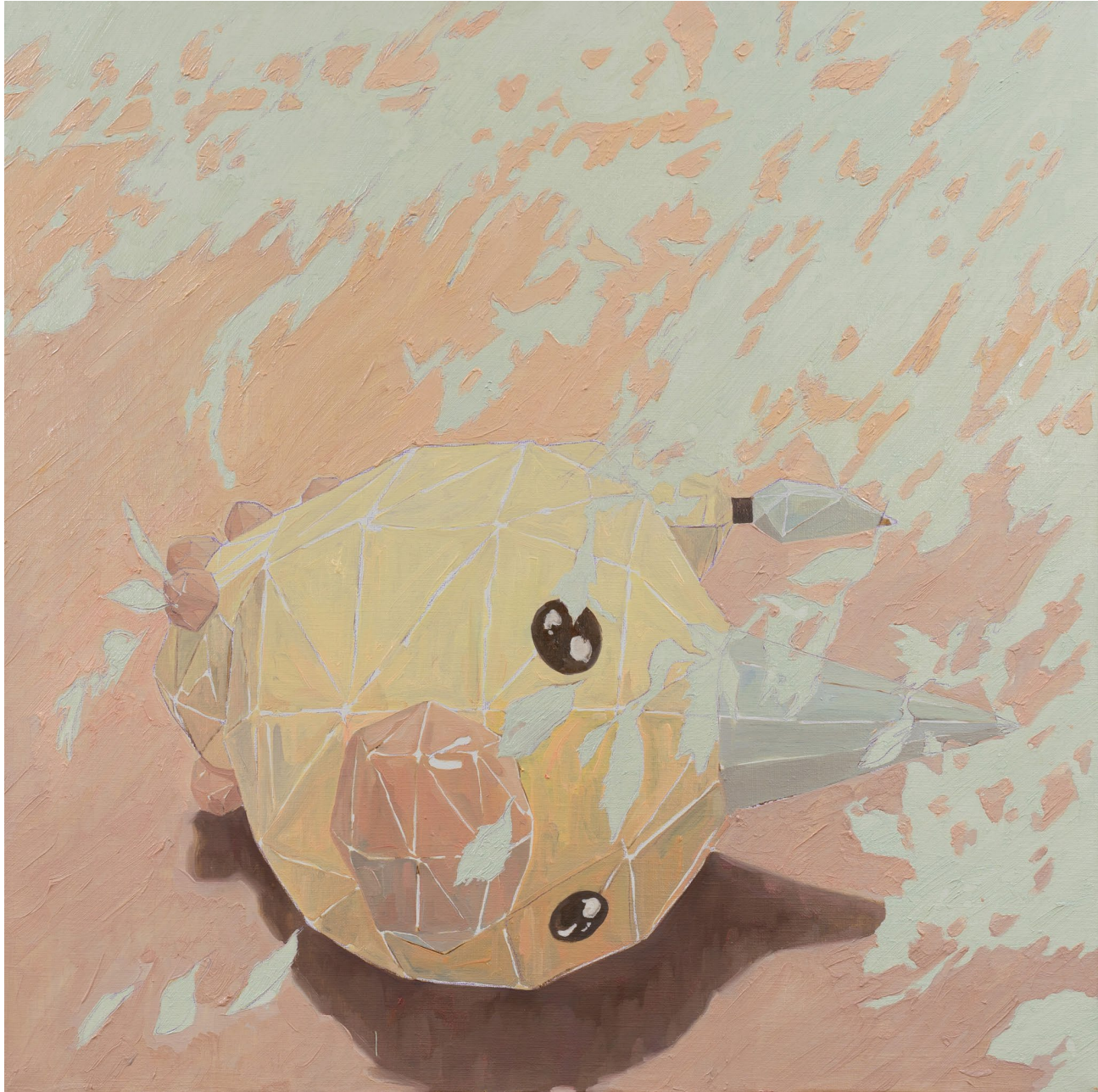
<캐터피가 되고싶었는데>, 2023. 캔버스에 유화, 72.5x72.5cm.