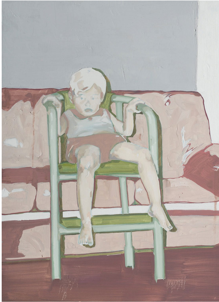
<사진을 싫어하는 아이>, 2020. 캔버스에 유화, 72.7x53cm.