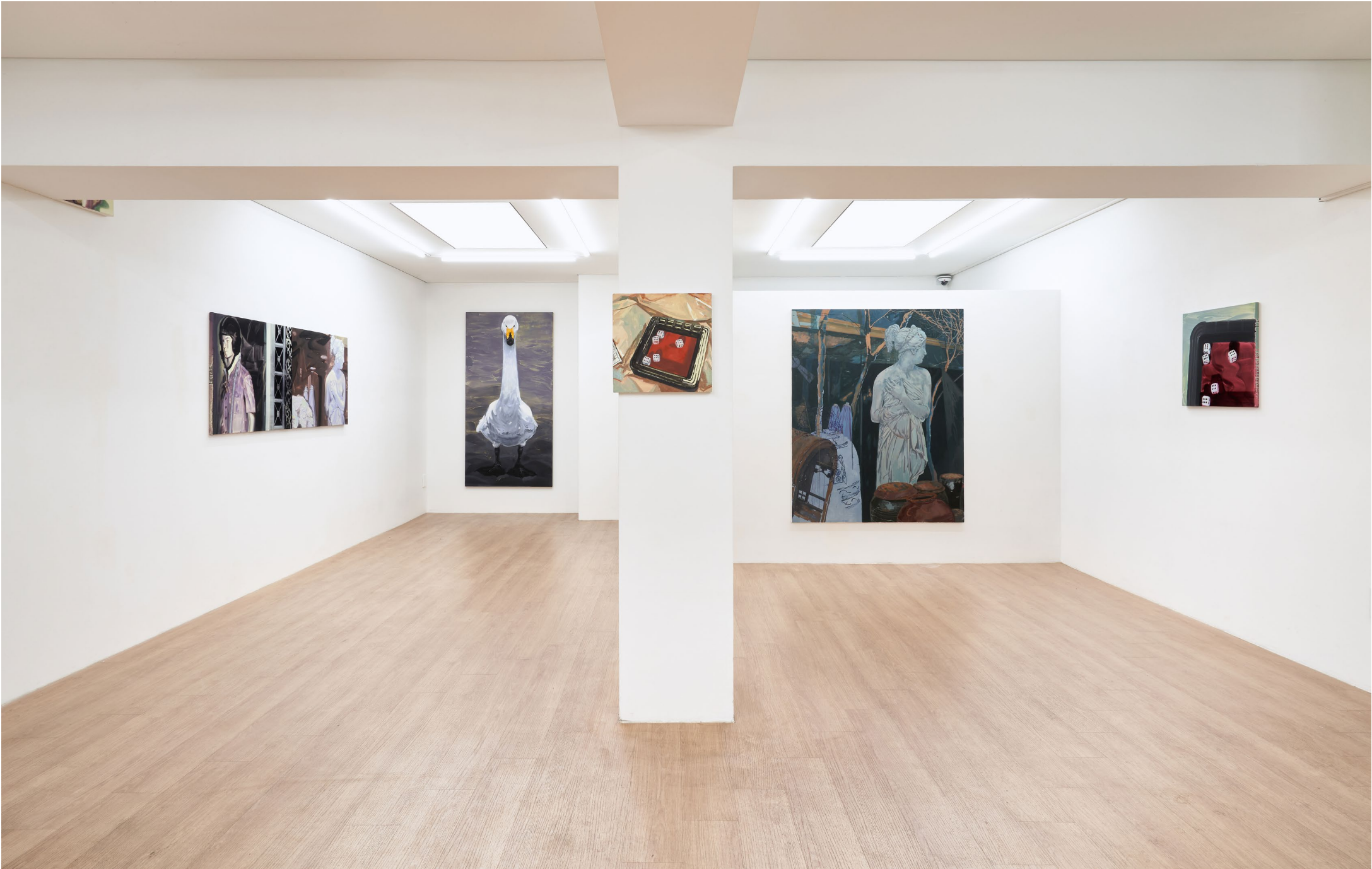
<어그로-스왑> 전시 전경