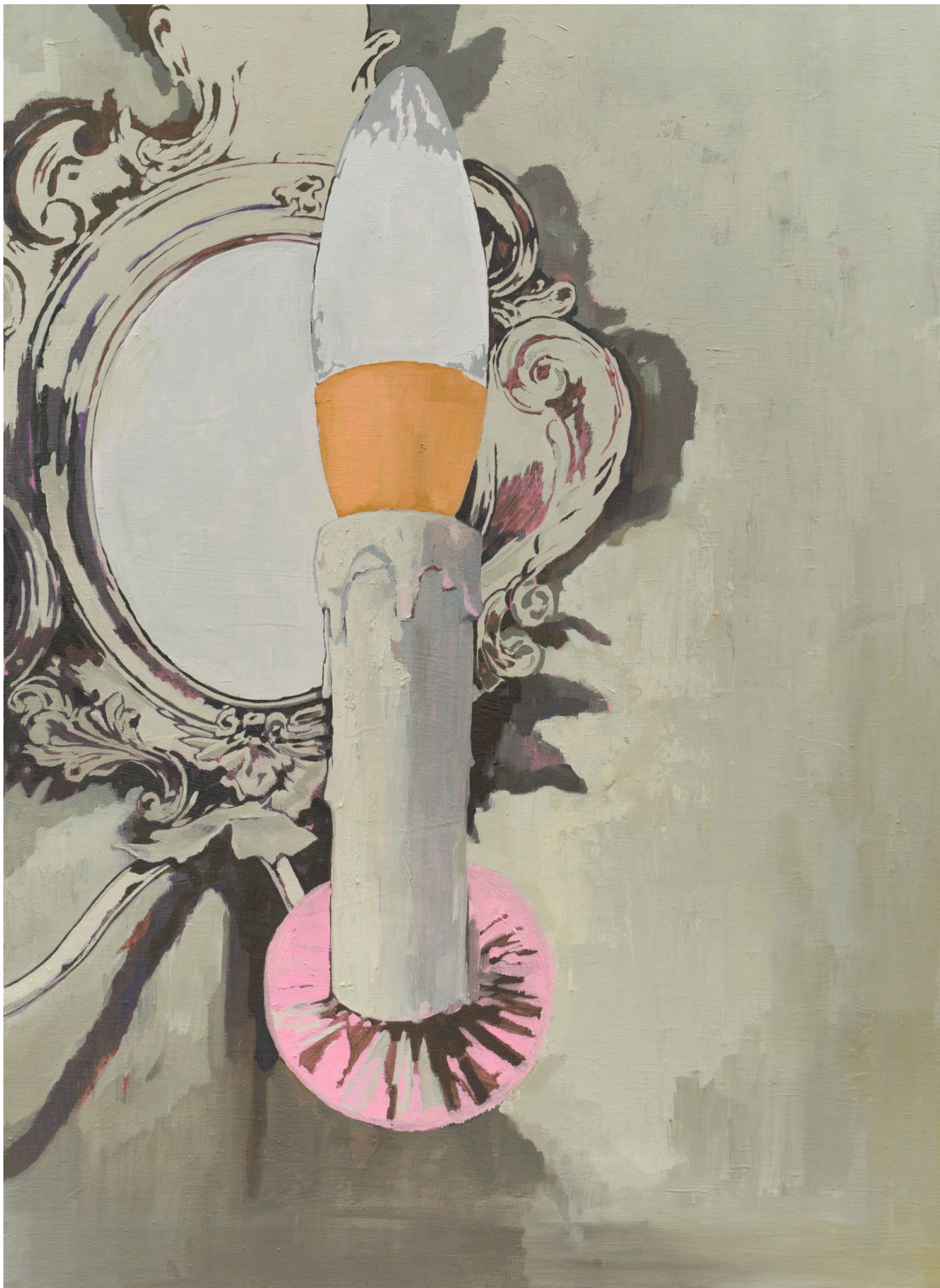
<가짜 촛불>, 2023. 캔버스에 유화, 100x72.7cm.