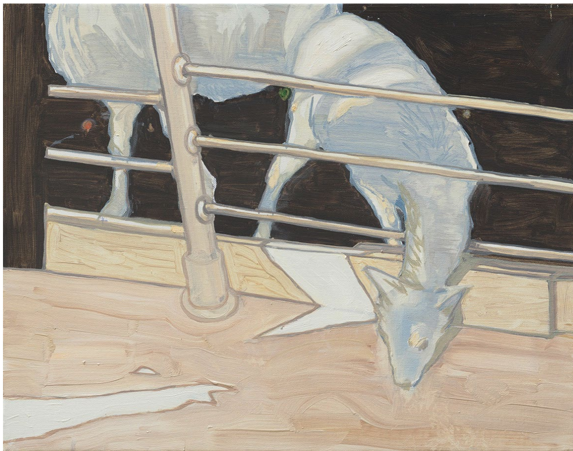
<밥은 한 퍽에 천 원>, 2020. 캔버스에 유화, 40.9x53cm.