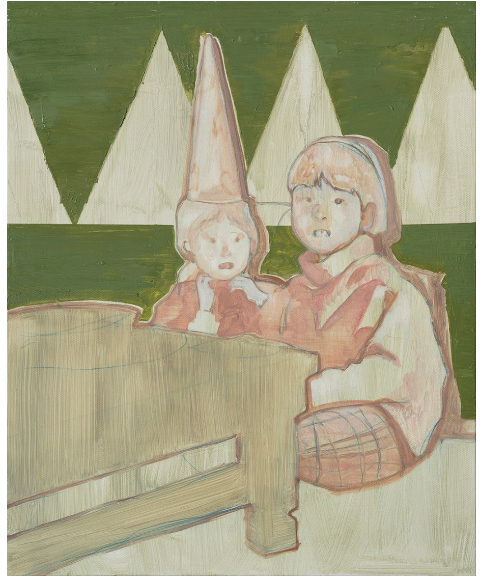
<돌 풍경>, 2020. 캔버스에 유화, 53x45cm. <언니>, 2020. 캔버스에 유화, 72.2x60.6cm.