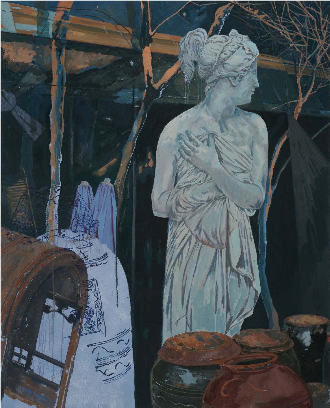
<창고 정렬 옵션: 가치>, 2024. 캔버스에 유화, 162.2x130.3cm.