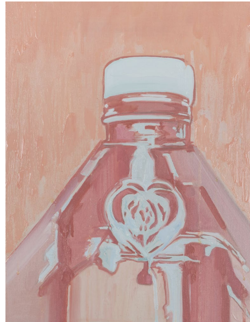
<아빠의 술>, 2022. 캔버스에 유화, 40.9x53cm. <병뚜껑>, 2021. 캔버스에 유화, 40.9x31.8cm.