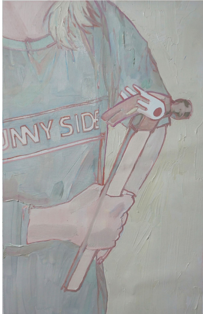
<요술망치>, 2021. 캔버스에 유화, 34x51.5cm.