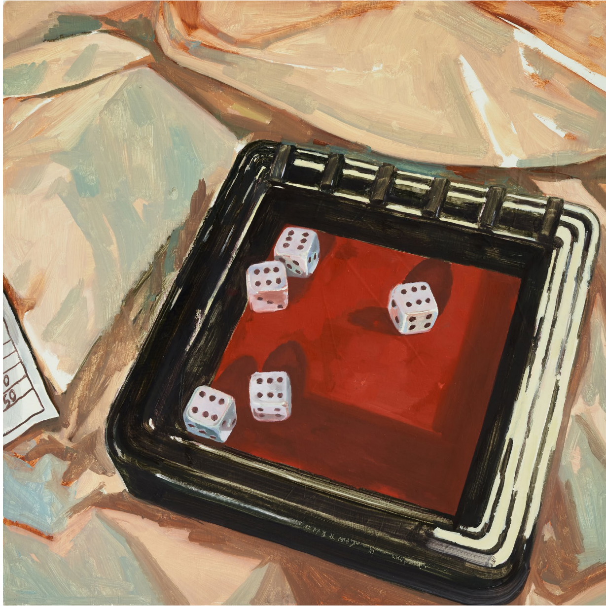
<미니 게임 스타트>, 2024. 캔버스에 유화, 37.9x37.9cm.