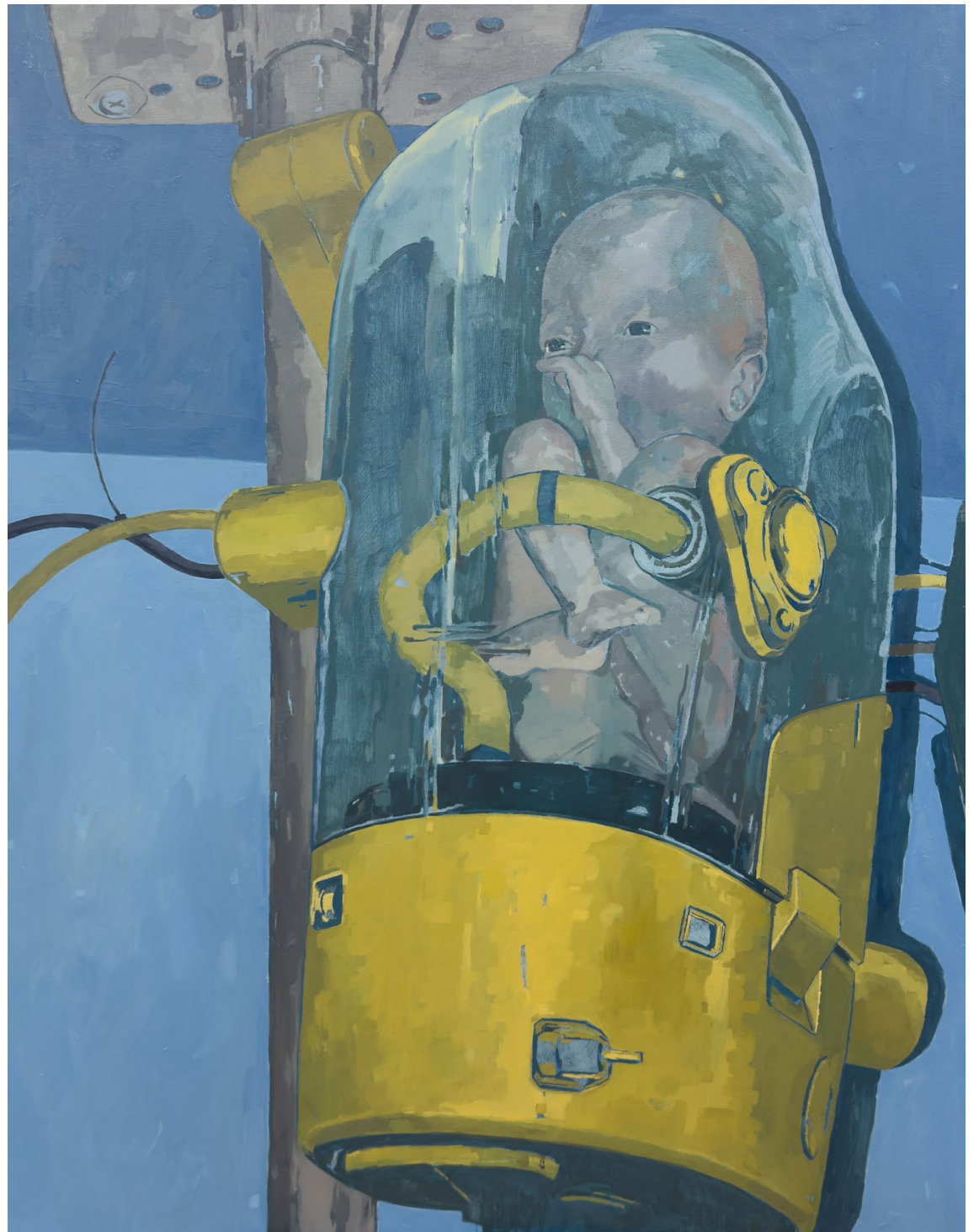
<n번째 비비>, 2023. 캔버스에 유화, 116.8x91cm.